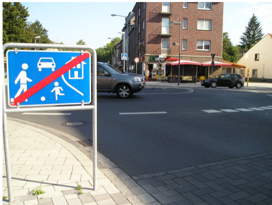
Kreisverkehr am Großenbaumer Bf