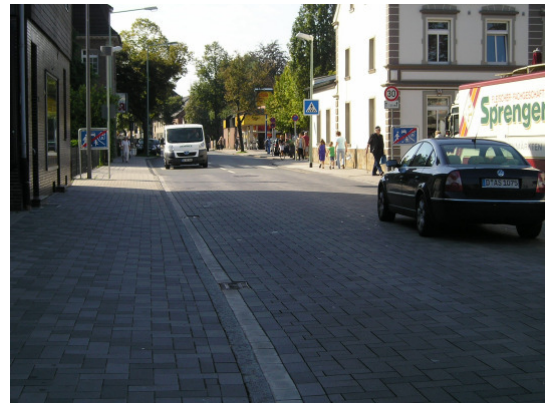
Verkehrsberuhigter Bereich am Großenbaumer Bf