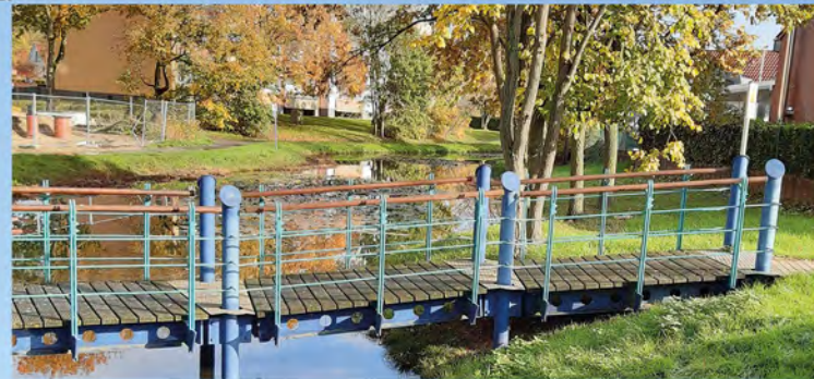
Brücke über den Wassergraben