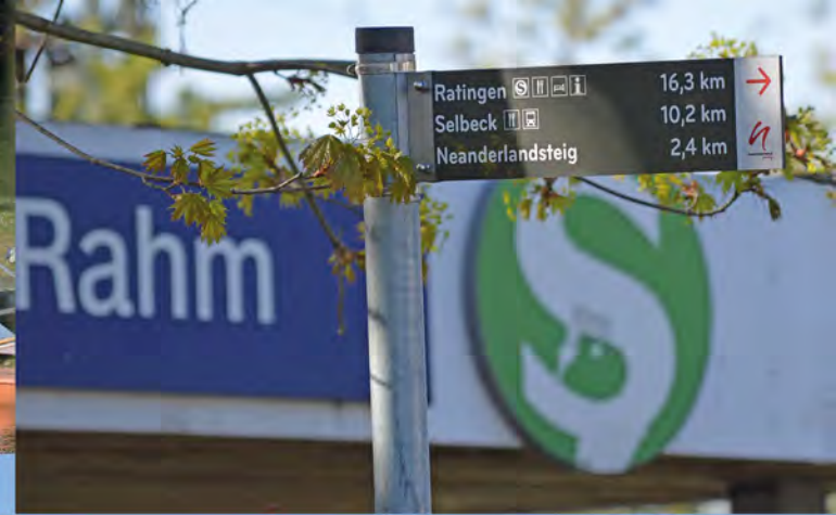
Zustieg zum Wanderweg Neanderlandsteig