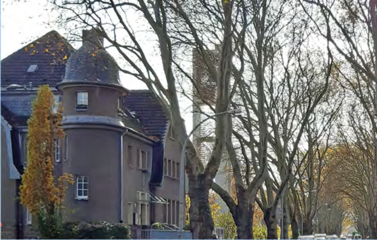
Evangelisches Gemeindehaus und Kirchturm