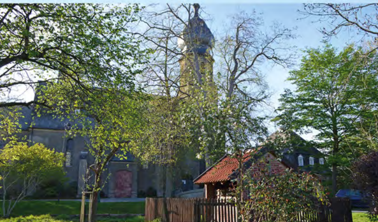
Katholische Kirche und Bienenhaus in Rahm