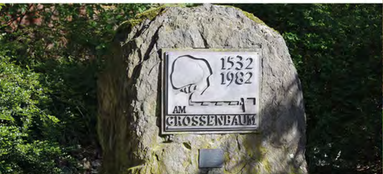
Ein Schlagbaum: Nordgrenze des Herzogtums Berg

Viele Spenden sorgen für einen Beitrag zum Klimaschutz: ↓ Der Bürgerverein pflanzt Obstbäume und Eschen →