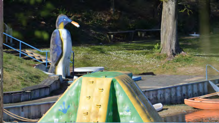
Freibad Großenbaum mit Pinguindusche